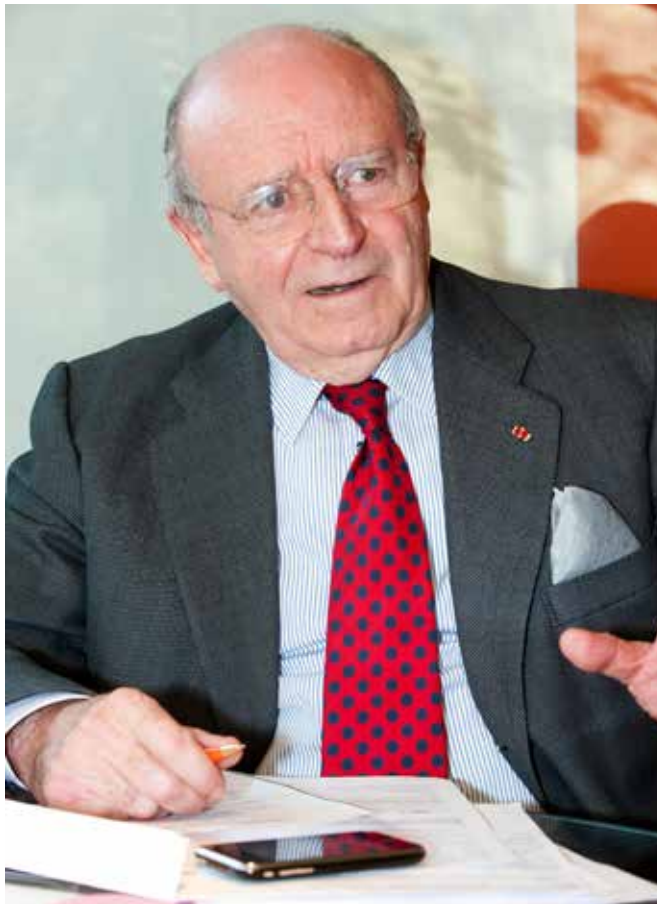
Abel Matutes Juan/Presidente Fundador

Los andares de la hoy notable Fundación Abel Matutes, que toma su nombre de su Presidente y fundador, se inician a finales de los 70 cuando Abel Matutes Juan fue elegido Senador y destinó la totalidad de su sueldo como tal para ayuda de los equipos deportivos infantiles de Ibiza y Formentera.