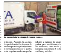
Un momento de la entrega de ropa de cama.

La Fundación Abel Matutes ha entregado ayer 12.000 euros a seis clubes de Eivissa para la compra de material deportivo. La entrega se realizó en el marco de un convenio de colaboración que la Fundación ha firmado con el Ayuntamiento de Eivissa. La Fundación Abel Matutes ha entregado ayer 12.000 euros a seis clubes de Eivissa para la compra de material deportivo. La entrega se realizó en el marco de un convenio de colaboración que la Fundación ha firmado con el Ayuntamiento de Eivissa.