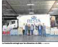
La Fundación entregó ayer los alimentos a las ONG.

La Fundación Abel Matutes entregó ayer dos toneladas de alimentos a las entidades solidarias Cáritas y Food for Ibiza. Estas ONG recibieron 2.000 kilos de pasta, 210 de arroz y legumbres, 35 de cereales y 11,4 toneladas de verduras y frutas frescas, además de varios kilos de galletas, aceite, salsas, cremas y otros productos de gran formato. Se trata de una donación que Palladium Hotel Group realizó cada año, a través de la Fundación Abel Matutes, por medio de la cual se distribuyen los alimentos