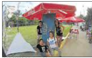
Voluntarios de la iniciativa 'Un juguete, una sonrisa'.

La iniciativa 'Un juguete, una sonrisa' recaudó 3.000 euros y 110 kilos de comida