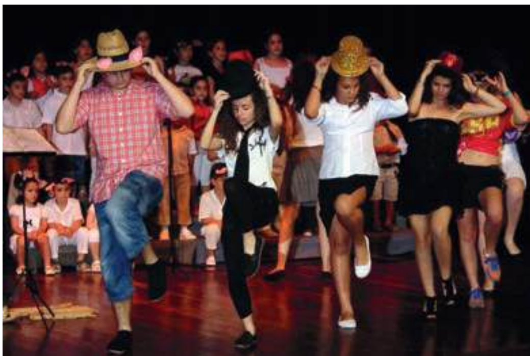
Los alumnos del XVI Camp Musical en una de las numerosas actividades.