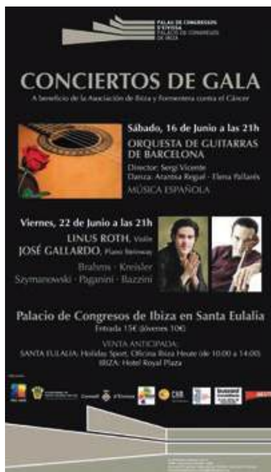
Cartel promocional de los conciertos a beneficio de la Asociación de Ibiza y Formentera contra el Cáncer.