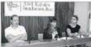
Momentos de la presentación del evento, en la Fundación Abel Matutes