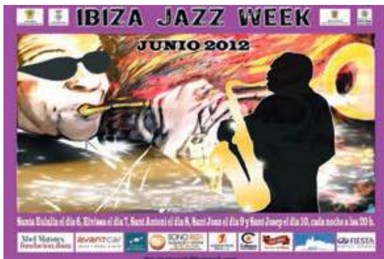
Cartel promocional del Ibiza Jazz Week.