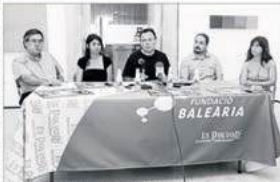
Presentación del ciclo, ayer por la mañana en la sala de El Pubert de Sant Joan.