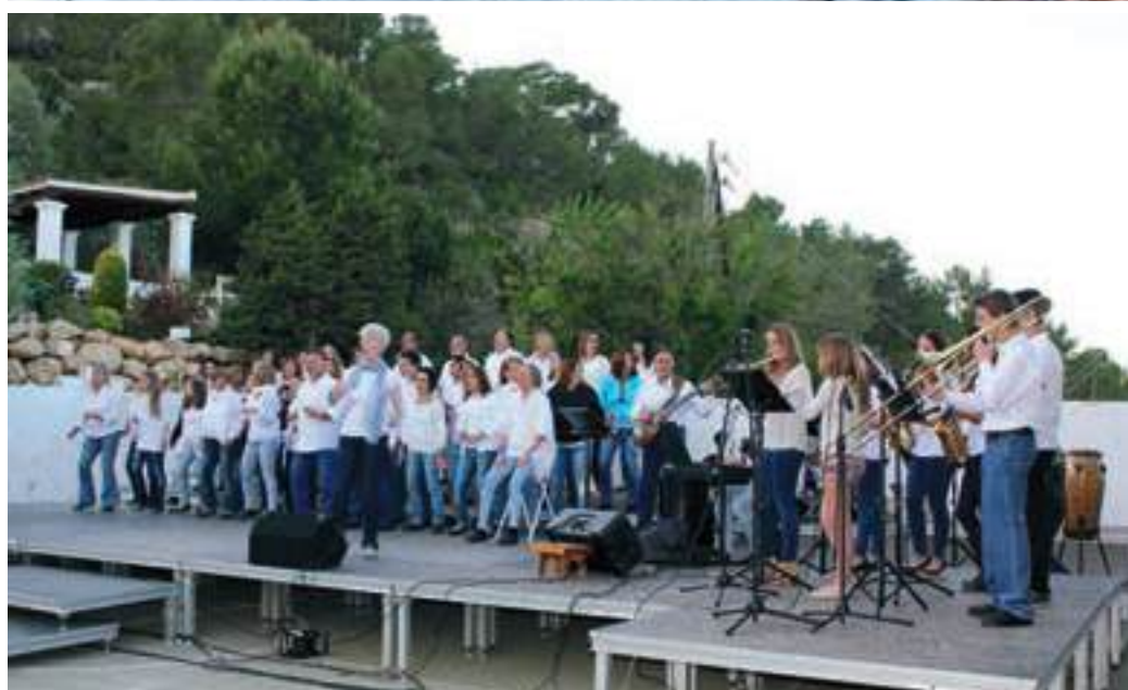
Integrantes del taller de coro góspel impartido por Moisès Sala i Deprius.