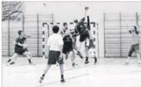
Una sesión de entrenamiento del 'Puchi' contra el HC Eivissa en un partido del año pasado

fundo capacitado para dar el salto a Primera Nacional. Miguel Ángel Escudell, entrenador responsable del HC Eivissa, reconoció que «están entrenando juntos tal y como se había dicho, pero no hay una verdadera unión». «El entrenador decide la semana que viene, por grado de comprensión y nivel, con qué jugadores