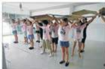
Actividad de una edición anterior del Camp Musical.

El XVI Camp Musical d'Estiu 2012, que organiza el Ayuntamiento de Sant Joan de Vilatorrada y el Club de Fútbol de Sant Joan de Vilatorrada, se celebrará el día 21 de julio en el campo de fútbol de Sant Joan de Vilatorrada. Para participar no es necesario tener conocimientos previos de música. El festival será de 6 a 10 horas de la mañana a la hora de la tarde. Las actividades incluyen danza, música de cámara, música, talleres de ensayo musical, juegos, expresiones, coreografía y talleres en los que se creará el propio grupo de música. Las actividades se celebrarán en el campo de fútbol de Sant Joan de Vilatorrada. Los talleres se celebrarán en el campo de fútbol de Sant Joan de Vilatorrada.